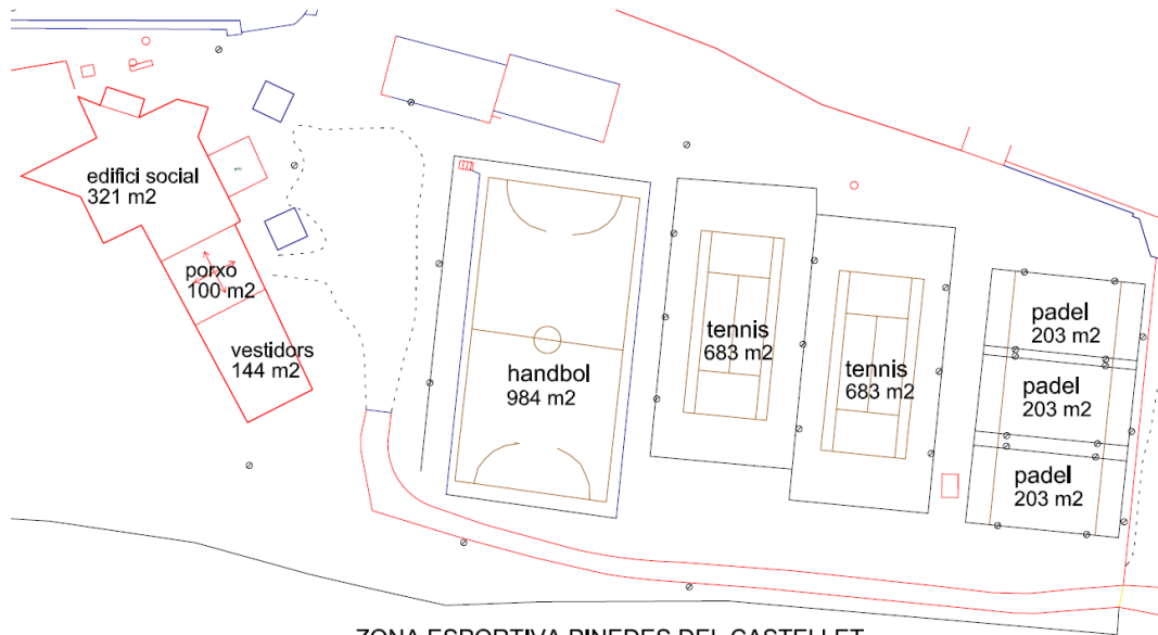
ZONA ESPORTIVA PINEDES DEL CASTELLET