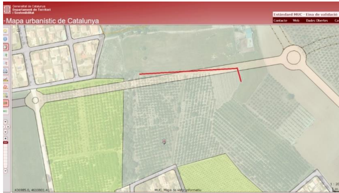
Fragment visor MUC amb capa ortofoto. Situació del tram de tanca de caràcter provisional, situada dins l'àmbit classificat de SX1p. Xarxa territorial projectada.

Aquest punt afecta únicament al tram de tanca amb llicència provisional: