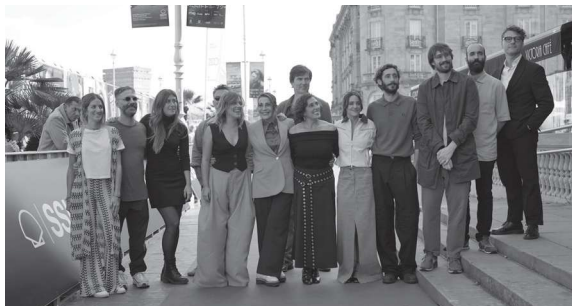
Part de l'equip de "Casa en flames" al Festival de Cinema de Sant Sebastià.