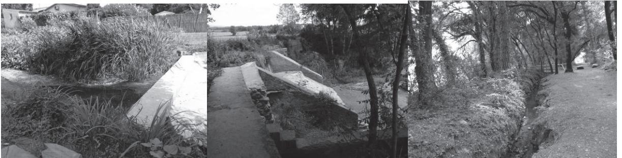
Fotos 1,2 i 3 (d'esquerra a dreta): Resclosa al gual de Sant Isidre o de can Font, Resclosa de la Casa Vella o de la Campinya, Rec de Baix o del molí del Vendrell

Som davant la resclosa de la Casa Vella o de la Campinya i en aquest punt d'aigües somes i tranquil·les, originat per la mateixa resclosa, podem veure com ha estat colonitzat per moltes plantes aquàtiques com: la boga, la salicària i els penjolls. A finals d'estiu o principis de tardor, és espectacular veure la florida de les nyàmeres o setembres. Aquesta resclosa està formada per una estructura de dos nivells, perpendiculars al riu i reforçada amb un contrafort per costat. El desnivell que suposa aquesta construcció sobre el curs de la riera fa que en aquest punt hi hagi dos salts d'aigua destacats. Al costat de ponent, el mur es perllonga per desviar l'aigua cap al rec, damunt del qual es llegeix "ANY / 1922". Està construïda amb murs de maçoneria revestits amb ciment.