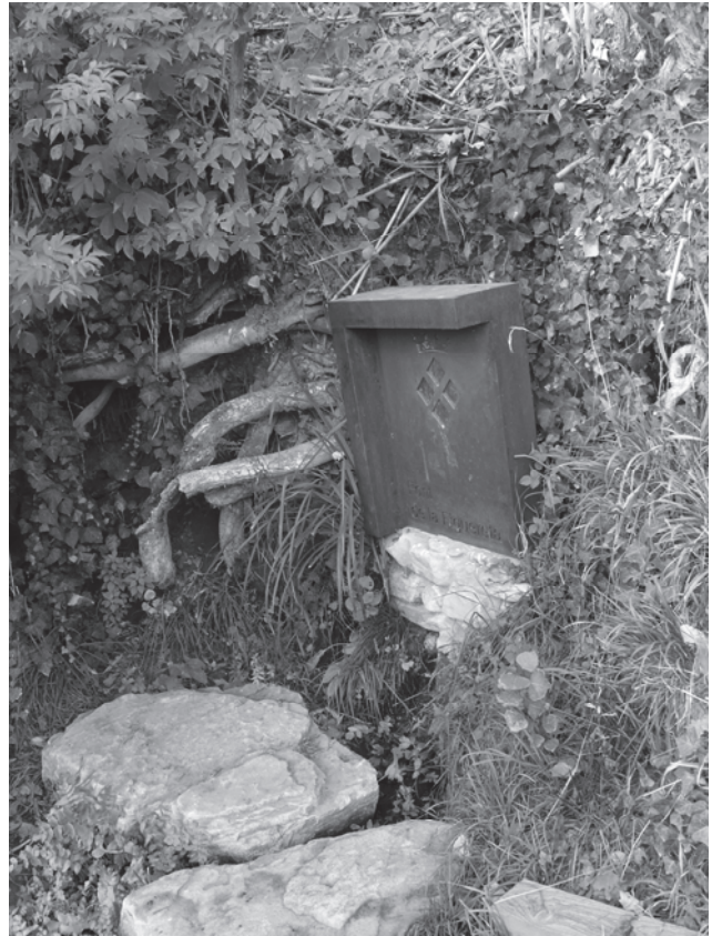
Foto 1. Font de la Figuera.

La font que jo sé no la trobaríeu: és al mig del bosc, al peu d'una alzina. Si hi passeu a prop, ella us cridaria; si no m'hagués cridat, jo no la sabria. Anava pel món de nit i de dia; allí on anava jo, ben poc ho sabia. Quan la vaig trobar, tot jo m'hi delia. Ella me'n va dir, ella me'n diria: -L'anar món enllà no et darà alegria, si et quedes aquí, jo sóc l'aigua viva.